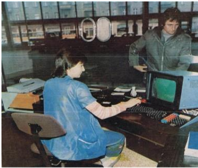
1980 Bahnhof Berlin-Lichtenberg

Erstmaliger Einsatz von Mikrorechnern in Verkehrsprozessen der DDR